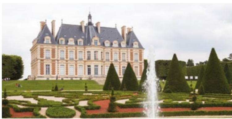
DOMAINE DÉPARTEMENTAL DE SCEAUX