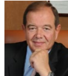
Patrick Ollier Député-Maire de Rueil-Malmaison Président de la Métropole du Grand Paris